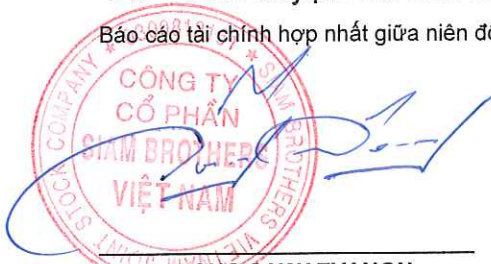
VEERAPONG SAWATYANON Chủ tịch

Báo cáo tài chính hợp nhất giữa niên độ đã được Hội đồng Quản trị phê duyệt để phát hành.